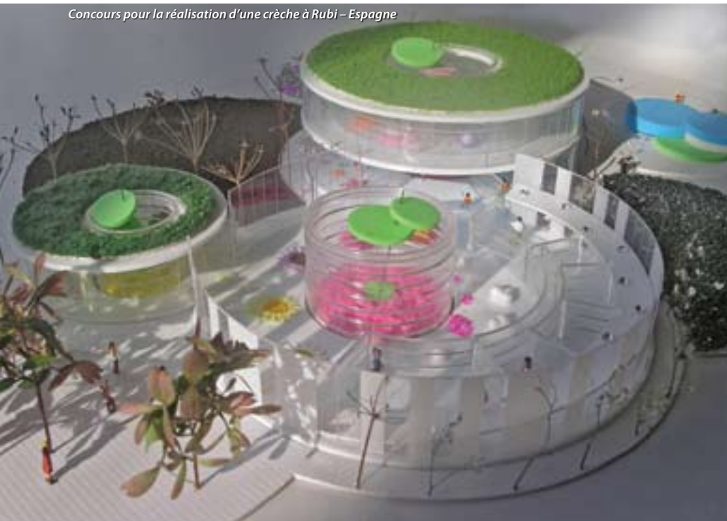
Concours pour la réalisation d'une crèche à Rubi - Espagne