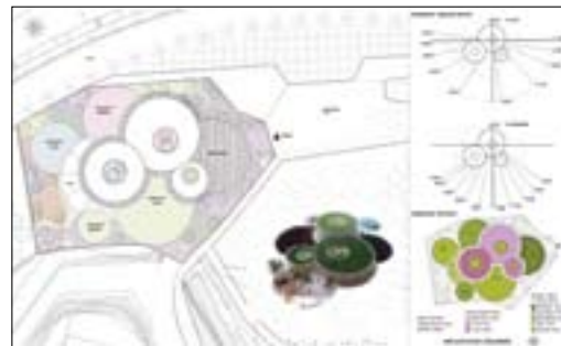
Implantation et schémas

Date - avril 2007 Devis - 850.000 € Surface - 2870 m² Client - commune de Rubi Collaborateurs - Fabienne Cuny