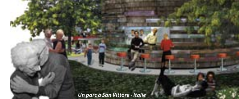
Un parc à San Vittore - Italie

R.F. : Les architectes qui nous intéressent le plus sont ceux qui sont les plus près de notre vision et ceux qui continuent à marquer une différence claire entre la profession, la critique, la théorie et la pratique et qui, au prix de beaucoup d'efforts, réussissent à tout réunir dans un projet et se font alors politiques à la sortie de leur agence. Ceux qui ainsi se rapprochent le plus émotionnellement des individus. Malheureusement, comme nous l'avons déjà dit, aujourd'hui l'architecture contemporaine se confond avec le système oligarchique qui règne actuellement dans les «plus grandes» revues du monde. Dans ce type d'architecture le message caché de chaque projet a disparu et elle ne parvient plus ni à émouvoir ni à faire vibrer les cœurs. Elle ne s'adresse pas non plus à «monsieur tout le monde» et, en cela, elle ne nous intéresse pas.